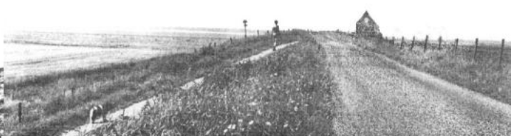
Foto links en boven. Het woonhuis van opzichter Kersten aan de Korendijk voorbij Goudswaard

Hij legde ons uit hoe we moesten lopen en waar een pad te vinden was door het rietgors, om bij de biezen te komen. De fietsen bleven staan, laarzen aan en banjeren maar onder langs de dijk. Huisman was een gezellige man die zichtbaar genoot van mijn aanwezigheid en allerlei planten aanwees die daar groeiden, zoals wilde selderij, wilde peen, watermunt, heemst harig wilgenroosje, om er maar een paar te noemen. Ergens lag een plank over de sloot en daar gingen