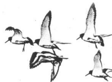
een groepje ogenpikkers

we de rietgors in richting Haringvliet. Ik bleef dicht bij de grote mannen want in het manshoge riet was je zo verdwaald! Na dat vervelende scherpe riet kwamen we bij ons doel, de biezenvelden, die in mei nog niet volgroeid waren zodat je er nog overheen kom kijken, 90 hectaren biezen, fantastisch! De enorme oppervlakte biezen was verdeeld in percelen of blokken. Op elke hoek van zo'n blok stond een lange wilgenstaak, waarin met Romeinse cijfers nummers waren gekerfd. Er liepen ook kreken door het gebied die dan een natuurlijke perceelgrens vormden. Bij een grote diepe kreek, die helemaal van het Haringvliet tot de dijk liep, werd ik geparkeerd want de mannen moesten naar de overkant. Ze hadden lieslaarzen aan en dicht bij het Haringvliet was een doorwaadbare plek. Ze zouden ongeveer een half uur wegblijven. Terwijl ik probeerde stekelbaarsjes te vangen, werd aan de overkant Jan Hogenboom geparkeerd! Zonder het van elkaar te weten (je houdt het niet voor mogelijk) had ook Krelis Hogenboom z'n biezenblokkers op pad gestuurd en die kwamen precies van de andere kant! Jan had ook geen lieslaarzen en moest dus ook wachten. Een groepje scholeksters vloog luid fluitend, tewiet, tewiet, over ons heen. "Zie je die vleugels daar met die lange rode bloedsnavels"? zei