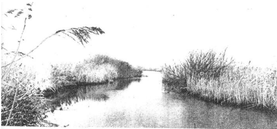
DE KREEK IN 1978 na de afsluiting van het Haringvliet in 1970 groeit er geen bies meer

Hij legde ons uit hoe we moesten lopen en waar een pad te vinden was door het rietgors, om bij de biezen te komen. De fietsen bleven staan, laarzen aan en banjeren maar onder langs de dijk. Huisman was een gezellige man die zichtbaar genoot van mijn aanwezigheid en allerlei planten aanwees die daar groeiden, zoals wilde selderij, wilde peen, watermunt, heemst harig wilgenroosje, om er maar een paar te noemen. Ergens lag een plank over de sloot en daar gingen