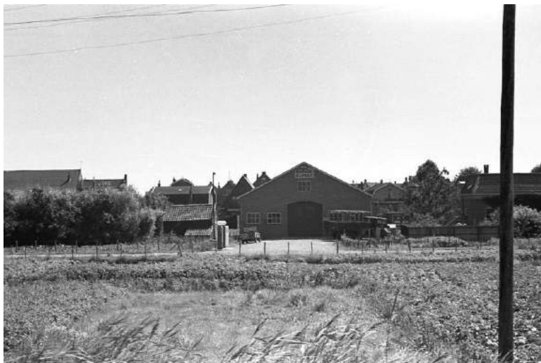
Foto 4. Rechts. Foto van de Molenwei van voor 1950, genomen vanaf het (begin van het) Molenpad in de richting van de boezem. In het centrum van de foto de (achter)ingang van de garage van G.

De Molenwei wordt van west naar oost doorkruist door de Molenstraat. Ten noorden ervan loopt het Molenpad er deels parallel aan, ten zuiden ervan loopt de Molenlaan er evenwijdig aan. Jan van Zutphenstraat, Wiekstraat, Schoestraat en Kaarstraat staan er haaks op.