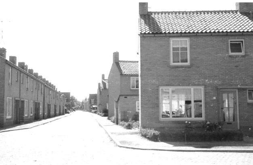
Foto 18 Molenstraat. De fotograaf staat vrijwel op dezelfde plaats als toen hij foto 6 maakte, alleen nu niet op de Molendijk.

Voor we de Molenlaan verlaten kijken we nog even om (zie foto 17)