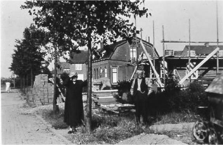
Foto 24 Molenpad. Ouders van Cor Koornneef voor hun huis Molenpad 5 in 1957.

Het pand in het midden van foto 24 is hetzelfde pand als dat links op foto 5, Molenpad 9 en 11. Rond 1957 zijn er vier panden bijgebouwd (nummers 1 t/m 7. Op de foto is nummer 7 in aanbouw.