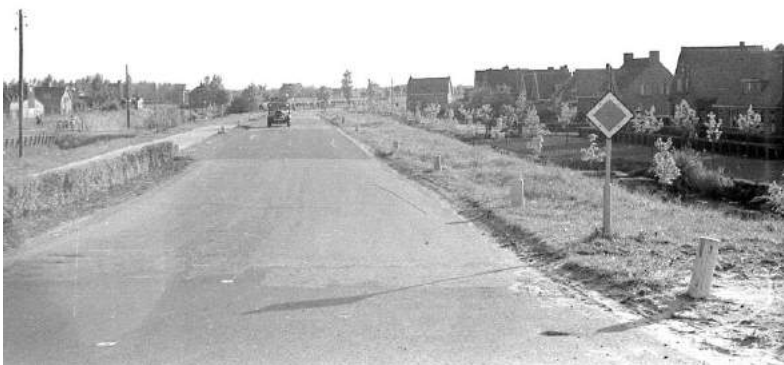
Foto 3 De Groene Kruisweg na het passeren van de tramrails. De rails liggen nu links van de weg. Rechts de Parallelweg.

Het rood/witte hek op de voorgrond vereist wat toelichting. Rijdend op de Groene Kruisweg vanaf Hoogvliet richting Spijkenisse moest ter hoogte van de Molendijk de tramrails overgestoken worden door een bocht naar rechts en daarna gelijk naar links te maken. Miste men die bocht naar rechts, dan reed men de Molendijk af en kwam men met een grote klap in de groenstrook onder aan de dijk terecht. Om de automobilist te waarschuwen voor deze bocht was dit hek geplaatst. Helemaal rechts op de foto is nog net een stukje van de tramrails en de tramdijk richting het station te zien. De tramrails liggen, voordat men die overgestoken was, rechts van de Groene Kruisweg. Op de voorgrond was vroeger een vuilnisbelt.