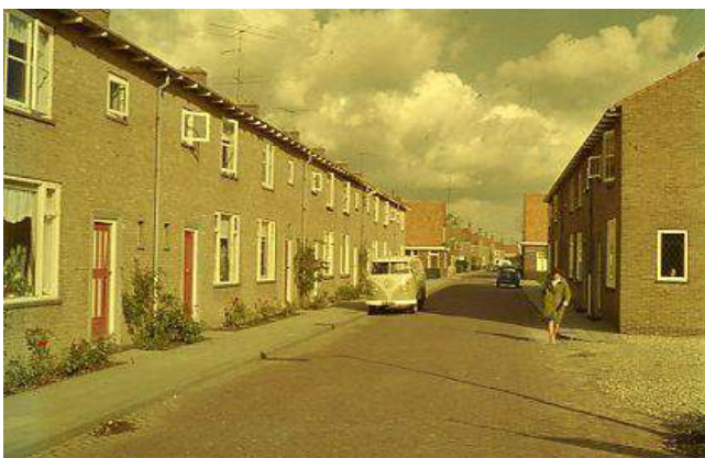
Foto 11. Genomen op dezelfde plaats als foto 10, maar negen jaar later.

Behalve dat foto 11 een kleurenfoto is, valt op dat er op foto 10 nog niet één auto te zien is en op foto 11 nog maar een paar.