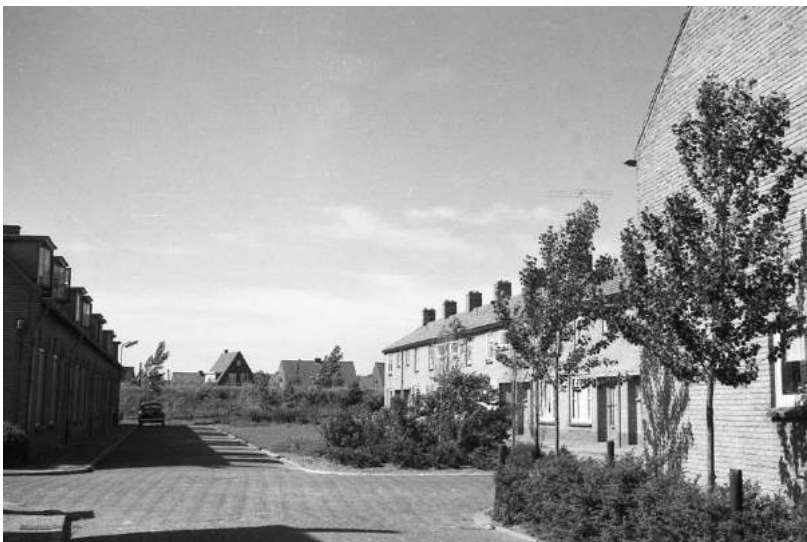
Foto 13 Links. Wiekstraat ten noorden van de Molenstraat in ca 1956.

De Wiekstraat staat haaks op de Molenstraat en heeft een deel ten noorden ervan (foto 13) en een deel ten zuiden ervan (foto 14). Op foto 13 zijn op de achtergrond de tramdijk en huizen aan de parallelweg te zien. In het noordelijke deel van de Wiekstraat is een perkje, aanvankelijk met gras en wat struikjes op de kopse einden, een ideaal voetbalveldje voor de jeugd.