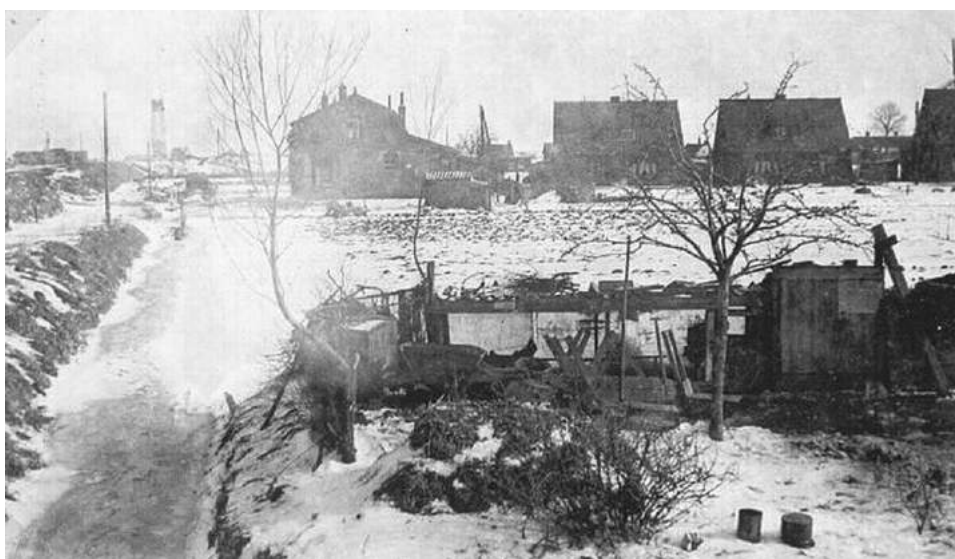
Foto 5 Links. Foto genomen vanaf Stationsstraat/begin Molenpad, in de richting van de brug. Het meest linkse pand is het huidige dubbelpand, op Molenpad 9 en 11, de twee andere dubbelpanden staan op het eind van de Jan van Zutphenstraat (nummers 20 t/m 26)

van Pelt aan de Molenstraat. De vooringang ligt aan de Molenlaan (aan de boezem).