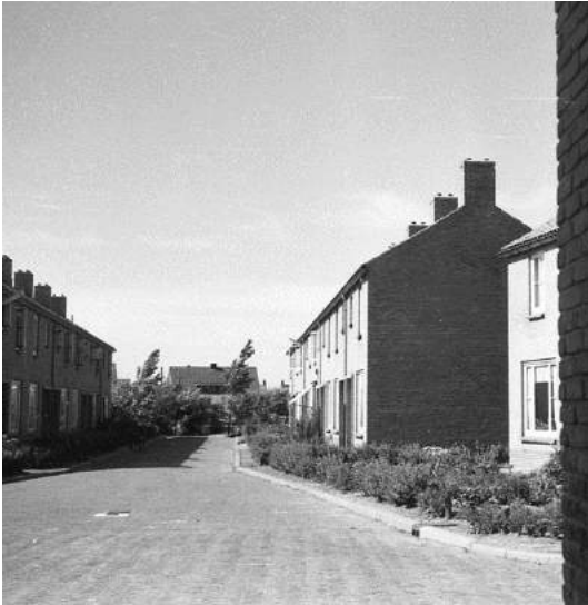
Foto 19 Links. Schoestraat, gezien vanuit het slop tussen Molenstraat 36 en 34. Op de achtergrond de groenstrook, tramdijk en huizen op de Parallelweg.