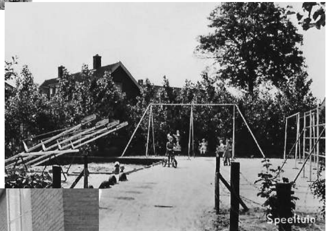
Foto 16 Boven. Speeltuintje aan einde van de Molenlaan

Lopen we in gedachten in foto 15 naar de grote boom dan buigt de straat aan het einde naar links om uit te komen op het eind van de Molenstraat. We passeren dan een speeltuintje met een grote zandbak, wippen, schommels en klimtoestellen (Foto 16)