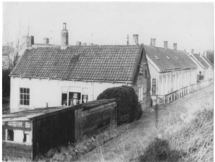
Foto 26 Onder. Beneden Molendijk met bebouwing van voor 1950. Gezien vanaf de Molendijk, kijkend in de richting van de molen.