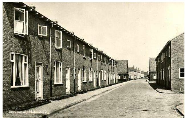
Foto 10 Rechts Molenstraat kijkend in de richting van de Molendijk (1954). Rechts, de ingang van Garage G. van Pelt, dan een rijtje van vijf woningen (huidige nummers 2 t/m 10), links een rijtje van negen. De huizen verderop, met de nok haaks op de straat, staan aan de Jan van Zutphenstraat, aan het eind zien we de huizen aan het begin van de Wiek-, Schoe- en Kaarstraat.