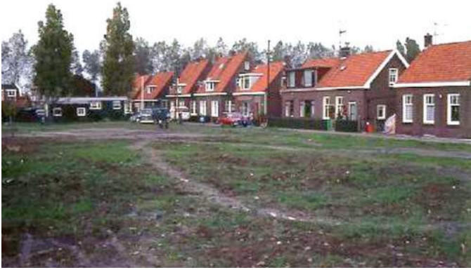
Foto 12 Gezicht op de huizen aan de Jan van Zutphenstraat (eind zeventiger jaren).