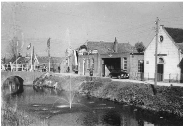
Foto 21 Links. Begin van de Molenlaan langs de boezem (vanaf de eerste Heulbrug naar de Wiekstraat) (1949). Op de hoek Garage G. van Pelt, daar naast de zaal van het Leger des Heils Molenlaan 2).

Een deel van de Molenlaan was al te zien op foto's 15 en 17.