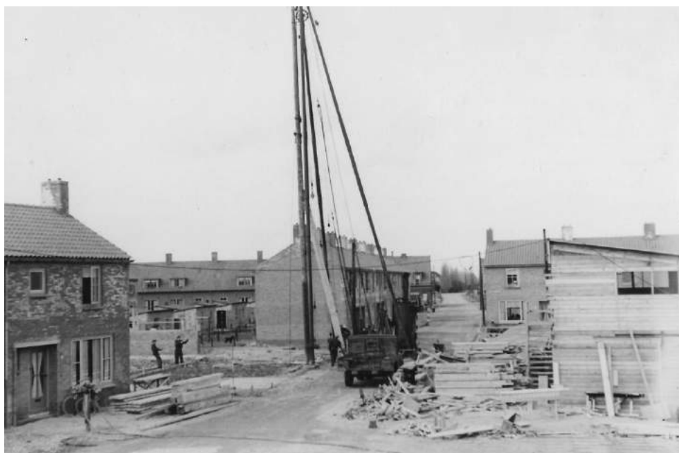
50), achter de heistelling een rijtje van acht (nummers 20 t/m 34). Geheid wordt voor een rijtje van vier huizen, nummers 36 t/m 42. Tussen de heistelling en nummer 44 zijn huizen aan de Wiekstraat te zien. Aan het begin van de Molenstraat staan de bomen op de Stationsstraat langs het tramstation.