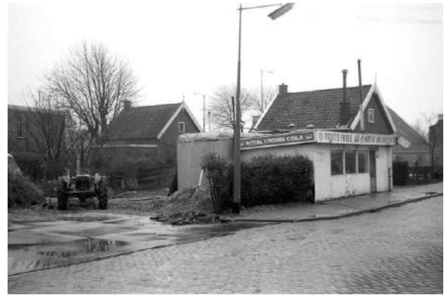
Foto 7 Boven, links. Begin van de Molenstraat, gezien vanaf de Stationsstraat Foto 8 Boven, rechts. Begin van de Molenstraat, gezien vanuit de Molenstraat.

Op foto 7 staan we op de Stationsstraat kijkend naar de hoek van de Stationsstraat en de Molenstraat. Uiterst links zien we weer de garage van G. van Pelt en nog net de patatkraam, die beter te zien is op foto 8, Daarop staan we aan het begin van de Molenstraat en kijken we in de richting van de Stationsstraat. De patatkraam dateert van augustus 1958 blijktens een krantenknipsel uit die tijd.