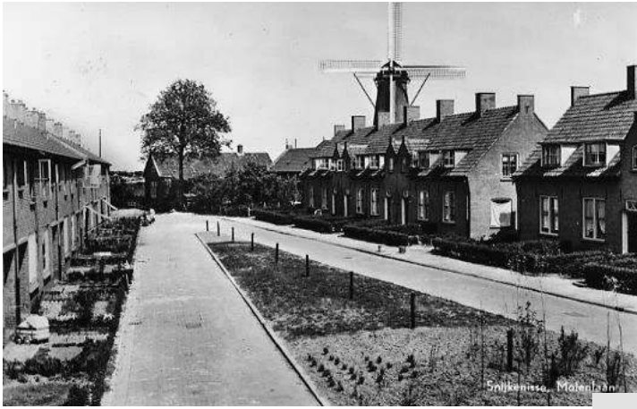
Foto 15 Links. Molenlaan gezien vanuit de Wiekstraat. In het midden van de foto het dubbelpand van de machinist van het gemaal "De leeuw van Putten". De huizen aan de rechterkant staan langs de boezem, de achtertuinten van de huizen aan de linkerkant grenzen aan de achtertuinten van de Molenstraat.

Lopen we in gedachten in foto 15 naar de grote boom dan buigt de straat aan het einde naar links om uit te komen op het eind van de Molenstraat. We passeren dan een speeltuintje met een grote zandbak, wippen, schommels en klimtoestellen (Foto 16)