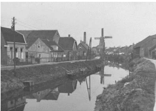
Foto 22 en 23 met panden van voor 1950, genomen vanaf de Bermweg.