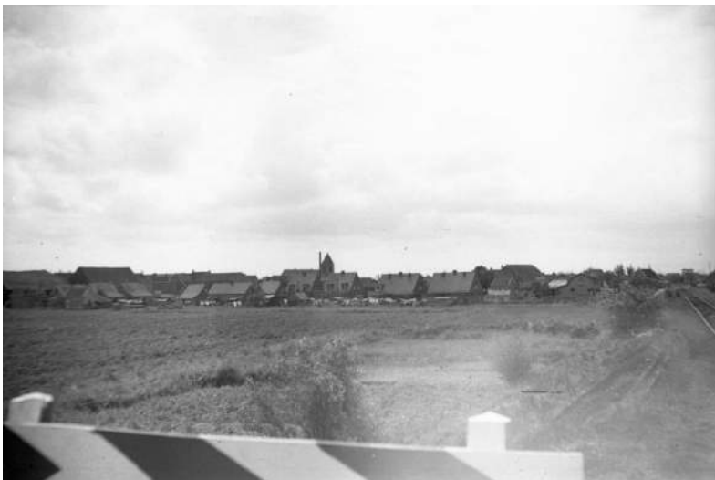
Foto 2 Links. Gemaakt vanaf het kruispunt van de Groene Kruisweg en de Molendijk in de richting van de dorpskerk, dus diagonaal over de Molenwei.

Voor de bouw van de huizen in de vroege vijftiger jaren stonden er al enkele: langs de boezem (9, volgens omnummeringstabel van 1 december 1948), in de Jan van Zutphenstraat (13 woningen), Molenpad (één pand) en de Wiekststraat (één pand), Op foto 2 is dat te zien.