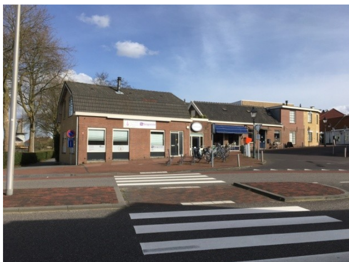
Foto 12. Voormalig woonhuis/winkel en smederij van Van den Heuvel in maart 2017.

In het voormalige woonhuis/winkeldeel is nu Massagewinckel gevestigd, in de voormalige smederij heeft nu het koffie- en theehuis "In den Biesenschuur" haar domicilie.