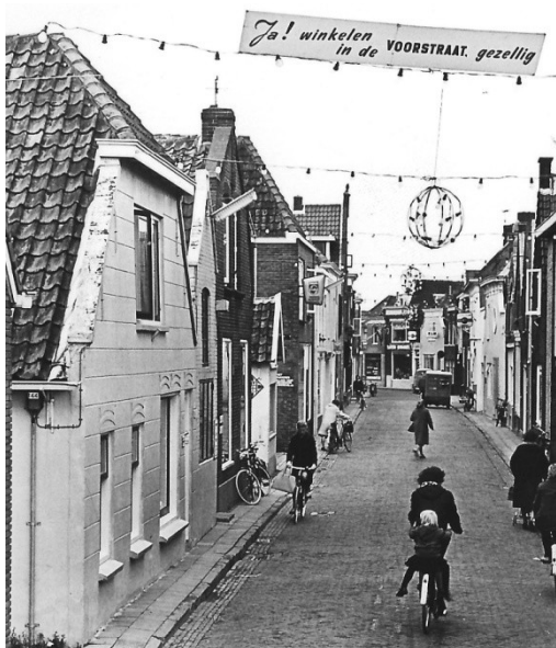
Foto 5 (links). Voorstraat 56 (witte pand geheel links) in de zestiger jaren.