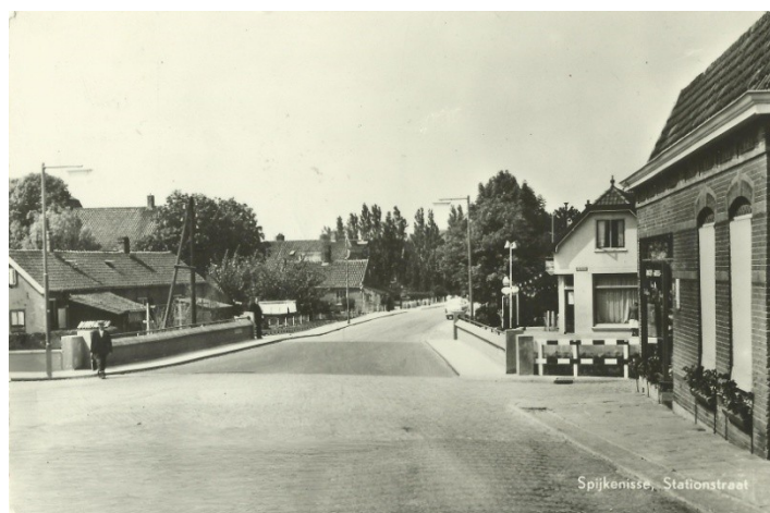
Foto 11. (rechts) Uiterst rechts de winkel en woonhuis van van den Heuvel in de zestiger jaren.

Naast de smederij was er ook een winkel waar o.a. haarden verkocht werden.