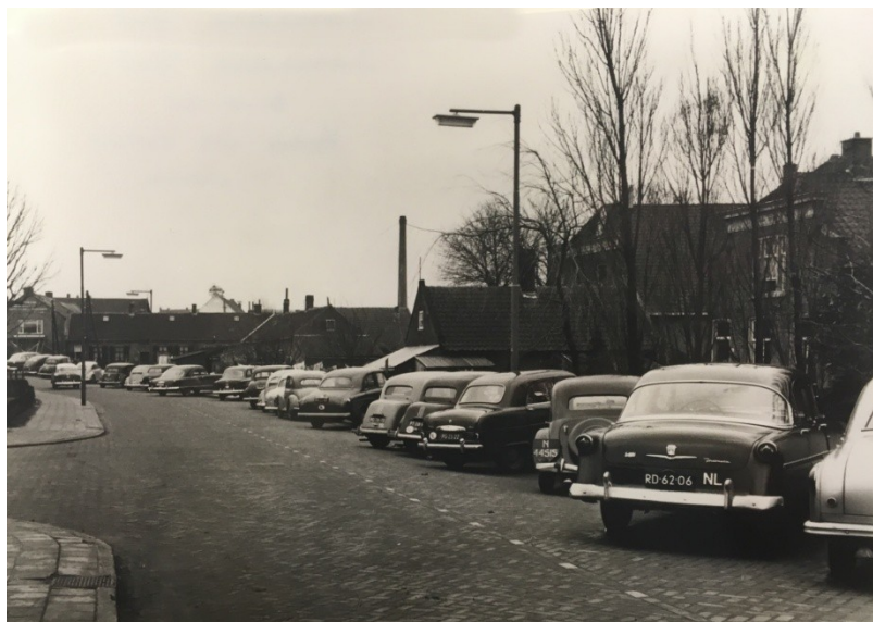
Foto 3 Stationsstraat in 1955

Uit de verhalen die bezoekers van de oudheidkamer vertellen, blijkt dat de degenen die net voor, in of net na de tweede wereldoorlog geboren zijn, zich nog heel goed herinneren dat er veel buiten gespeeld werd en dat veilig ook op straat kon omdat er nog zo weinig auto's waren. Met dat in gedachte viel een foto uit 1955 (foto 3) van de Stationsstraat wel heel erg op.