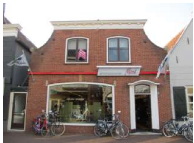
Foto 8 Winkel van Fietsspecialist Mons, Voorstraat 28, op 25 maart 2014