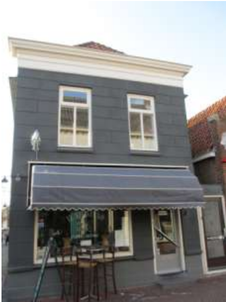
Foto 9 Voorstraat 30 op 25 maart 2014,