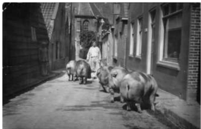
Foto 5 gunt ons een blik in het verdwenen stukje Kerkstraat. De fotograaf stond met zijn rug naar de Achterweg. Rechts vooraan is de winkel van de gebroeders Mol. De varkens wachten op het moment dat ze geslacht zullen worden. De slachtplaats bevond zich direct achter de winkel.