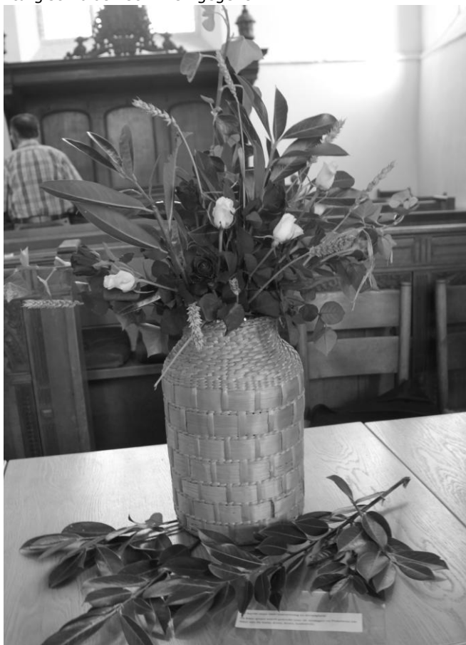
Liturgisch bloemschikken in de Dorpskerk Spijkenisse.

Als onderdeel van Stemmen uit Spijkenisse was er een optreden van het Randstedelijk Mannenkoor. Aansluitend aan het thema Groen van Toen werd er een demonstratie liturgisch bloemschikken gegeven.