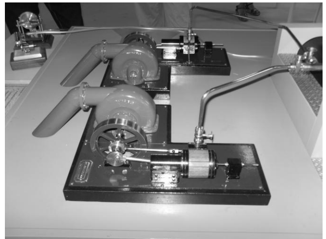
Maquette van de pompinstallatie. Foto uit 2011

weer opgesteld in het gemaal en gaven geïnteresseerden enthousiast tekst en uitleg. Naar aanleiding van originele tekeningen uit 1880 en bezoekjes aan musea werden de toenmalige ketels en pompinstallatie van het gemaal "De Leeuw van Putten" nagebouwd. Minutieus is elk detail uitgevoerd. Het resultaat was dan ook schitterend.