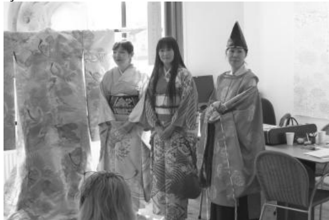
Japanse mode

De Federatie Spijkenisse Samen (FSS) heeft de bezoekers van Open Monumentendag tegenover In den Biesenschuur kennis laten maken met de groene en andere mooie elementen uit de Japanse cultuur. Thee, waarvan de oorsprong in Azië ligt, is een van de groene producten die niet meer weg te denken zijn in onze cultuur. Door de handelsgeest van de V.O.C. kwamen heel veel oosterse producten op de westerse markt, eerst als zeer exclusief en duur. Nu is thee een heel algemeen product. In Japan wordt de thee met veel ceremonieel en zorg bereid. Dat was te zien voor de Biesenschuur, waar thee verkocht wordt en mensen kunnen genieten van een high tea. De Japanse kleding is een andere bijzondere kunstvorm, die in 't Oude Raadhuis te bewonderen was. Met name de prachtig geborduurde trouwmantel oogste veel bewondering. Getoond werd hoe de traditionele kleding aangetrokken wordt. Dat is een tijdrovend ritueel dat wel 2 uur kan duren.