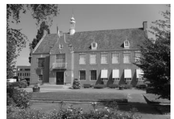
Bijvoorbeeld de „PRACHT“ van een gebouw.