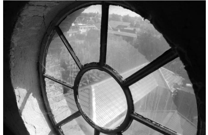
Dorpskerk Hekelingen.

kantige spits. De voorgevel heeft een uitgebouwde kopgevel, voorzien van een waterlijst boven is het raam en een kroonlijst boven de hoofdingang. De rondboogramen zijn aangezet geaccentueerd door waterlijstdorpels op natuursteen consoles. Boven de deuren bevindt zich een doorgaande waterlijst. De lengte van de kerk bedraagt 18.25 meter de breedte 8.85 meter en de hoogte eveneens 8.85 meter. In 1962-1963 toonde de kerk de nodige gebreken en vond een restauratie plaats.