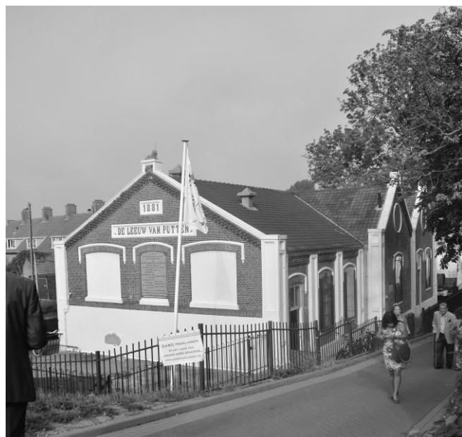
Gemaal de Leeuw van Putten.

gemaal De Volharding) bediend kan worden. In 1988 worden de oude pomp en motor gesloopt. Ze worden vervangen door een moderne pomp en elektromotor. Ook de elektrische installatie wordt deels vervangen. De komende 11 jaar heeft het gemaal geen bouwkundig onderhoud meer nodig. In 1999 wordt de instroomconstructie van het gemaal vernieuwd. De oude houten damwanden worden vervangen door damwanden van staal. Ook wordt in dit jaar een grote reparatie uitgevoerd aan het dak. Een deel van het dak wordt demontabel gemaakt. Zo kunnen de motor en de pomp gemakkelijker in en uit het gemaal worden getild. Dit komt in 2000 goed van pas, als de pomp gerepareerd moet worden. Tijdens deze reparatie worden gelijktijdig veranderingen aangebracht, waardoor de pomp veel rustiger gaat draaien. In 2003 krijgt De Leeuw van Putten zowel van binnen als van buiten een facelift. Metsel- en stucwerk worden gerepareerd en vensters gerestaureerd. Ook wordt het gemaal voorzien van een CV installatie en een toilet. Zo is het gemaal beter geschikt om bezoekers te ontvangen. De elektrische installatie wordt helemaal nagelopen. En er wordt een permanente aansluiting voor een noodstroom aggregaat gemaakt. Met deze aansluiting kan het gemaal ook bij stroomuitval gewoon zijn werk blijven doen.