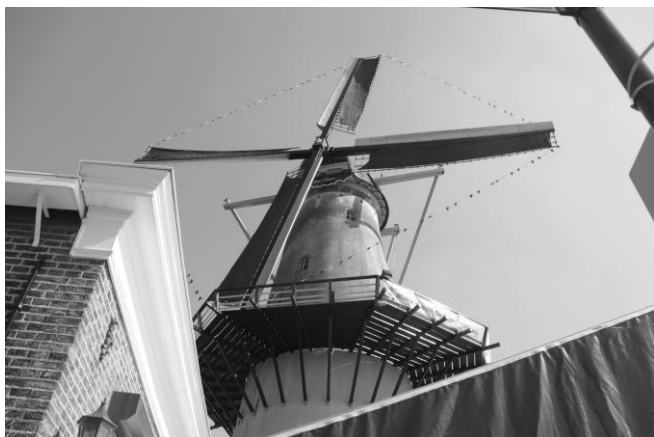
Korenmolen Nooit Gedacht.