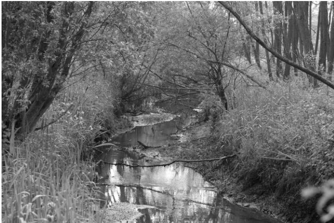
Natuurgebied Beerenplaat

Aantal deelnemers: 2 (stonden 9 personen op de lijst)