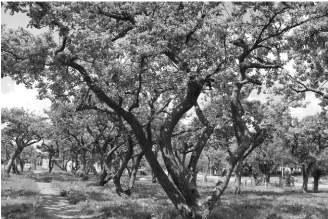
De boomgaard bij de Kinderboerderij "De Trotse Pauw"

Stichting Open Monumentendag, die samen met 330 plaatselijke comités de Open Monumentendag organiseert, wil met Groen van Toen aandacht vragen voor het monument in relatie met zijn groene omgeving. De reden om juist dit jaar voor dit thema te kiezen is dat 2012 het Jaar van de Historische Buitenplaats is. Het aanbod van Groen van Toen tijdens de Open Monumentendag was zeer gevarieerd. Veel groene monumenten zijn nadrukkelijk ontworpen en aange-