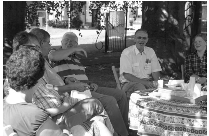
Gezellig onderonsje Dorpskerk Hekelingen.

De luidklok uit de eerste kerk van Hekelingen daterend uit 1285 (dit is de oudste klok van Nederland) deze bevindt zich sinds 1916 in het Rijksmuseum te Amsterdam. Het daarop volgende toren uurwerk stamt uit 1916 werd in 1979 uit de toren verwijderd en vervangen door een moderne moederklok. Dit torenuurwerk werd in opdracht van de Werkgroep Monumenten Spijkenisse gerestaureerd. De restauratie werd uitgevoerd door Kees van der Heijden die later in het bestuur van de werkgroep plaats nam. Het fraai gerestaureerde koperen uurwerk staat op zijn eigen eiken klokkenstoel in de hal van de trouwzaal van het oude gemeentehuis van Spijkenisse.