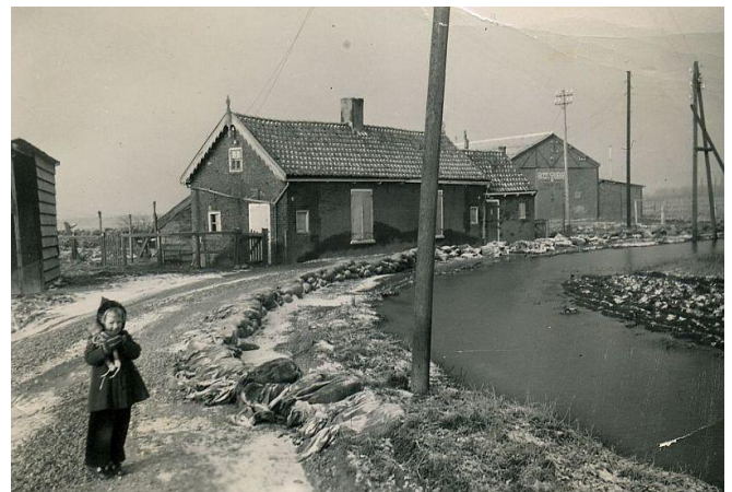
Bijvoorbeeld de „MACHT“ van het water.