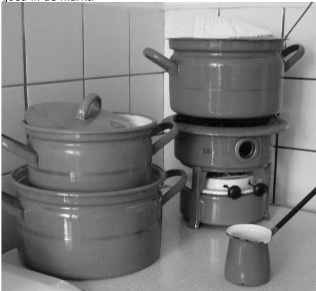
Groen van Toen

dubbel glas in de niet-draaiende delen van de vensters. Met uitzicht op een baan in de industrie en een huis zijn er uit alle hoeken van het land mensen naar Spijkenisse gekomen. Deze voor die tijd toch wel luxe appartementen lagen goed in de markt.