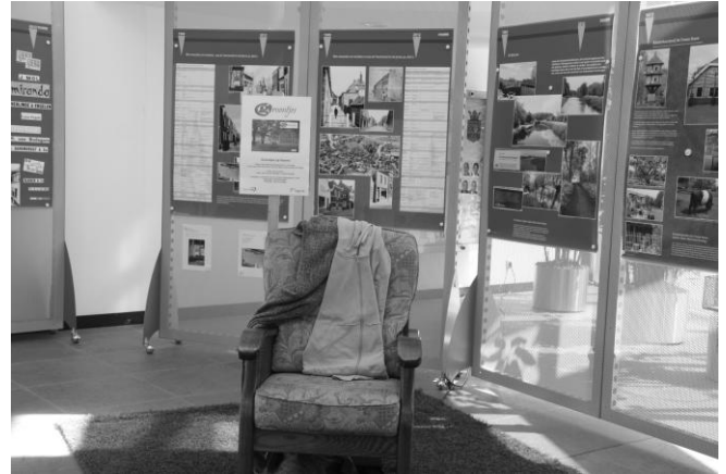
Een overzicht van de tentoonstelling.